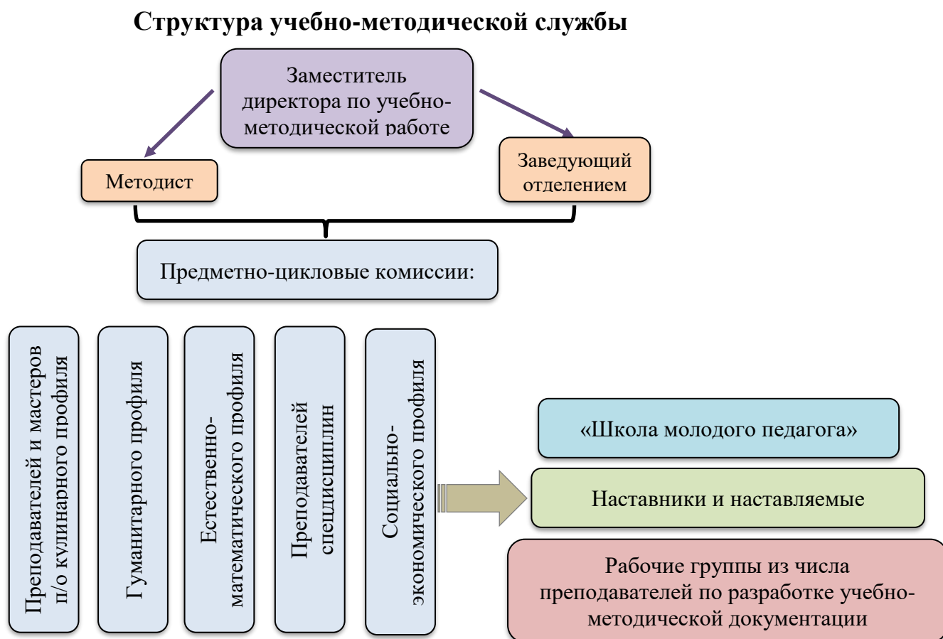
Схема № 2

Учебно-методическая работа в техникуме направлена на решение таких методических проблем, как учебно-методическое обеспечение образовательного процесса, модернизация традиционных технологий, развитие информационной среды техникума, мониторинг качества профессионального обучения.